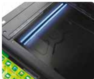
Lampes LED basse consommation