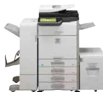
Système standard Meuble support 3 x 500 feuilles Plateau de sortie Unité de finition livret + passage papier Magasin latéral