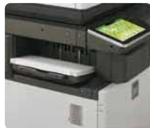
Unité de finition interne