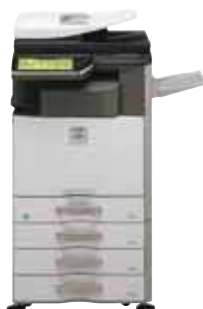
Système standard Meuble support 3 x 500 feuilles Plateau de sortie Unité de finition interne