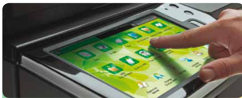
Un écran tactile à la pointe de la technologie pour une navigabilité intuitive

Le MX-2610N embarque un écran unique sur le marché de l'impression : un écran 10" doté de la technologie tactile qui a déjà révolutionné notre quotidien via les smart phones et les tablettes PC. L'aperçu du travail en cours permet de retravailler le document, supprimer ou ajouter une page, et ce par des appuis longs et des toucher glisser. Utiliser l'interface tactile d'un MFP n'a jamais été aussi intuitif et convivial.