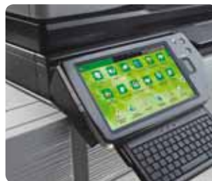
Ecran tactile couleur inclinable et clavier externe