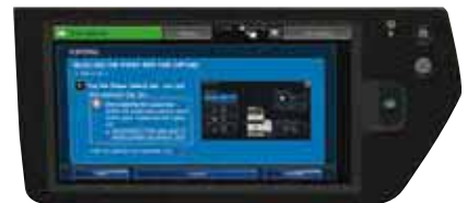
Manuel utilisateur accessible depuis l'écran tactile du système