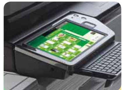
Stockage et prévisualisation couleur des documents