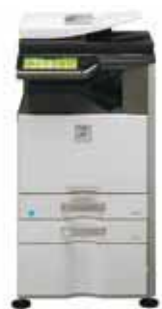
Système standard Meuble support 1 x 500 feuilles